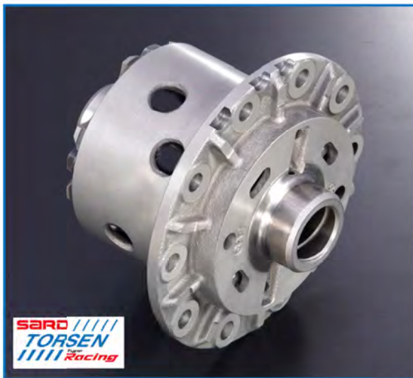
<SARD TORSEN Type Racing>