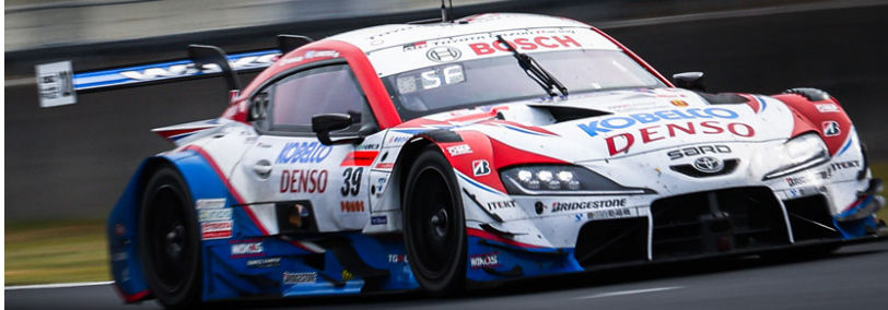
SUPER GT 第1戦岡山レポート