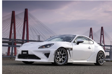
&lt;SARD GR86 GT1&gt;