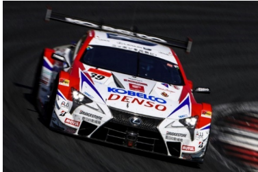
&lt;DENSO KOBELCO SARD LC500&gt;

9/26 (日) 豊田スタジアム「モータースポーツフェスタ」にSARDブースを出展 DENSO KOBELCO SARD LC500 / SARD GR86 GT1を展示！ 蔵出しレーシングスーツや旧チームウェアなども販売