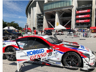
&lt;'20年第8回モータースポーツフェスタの様子&gt;