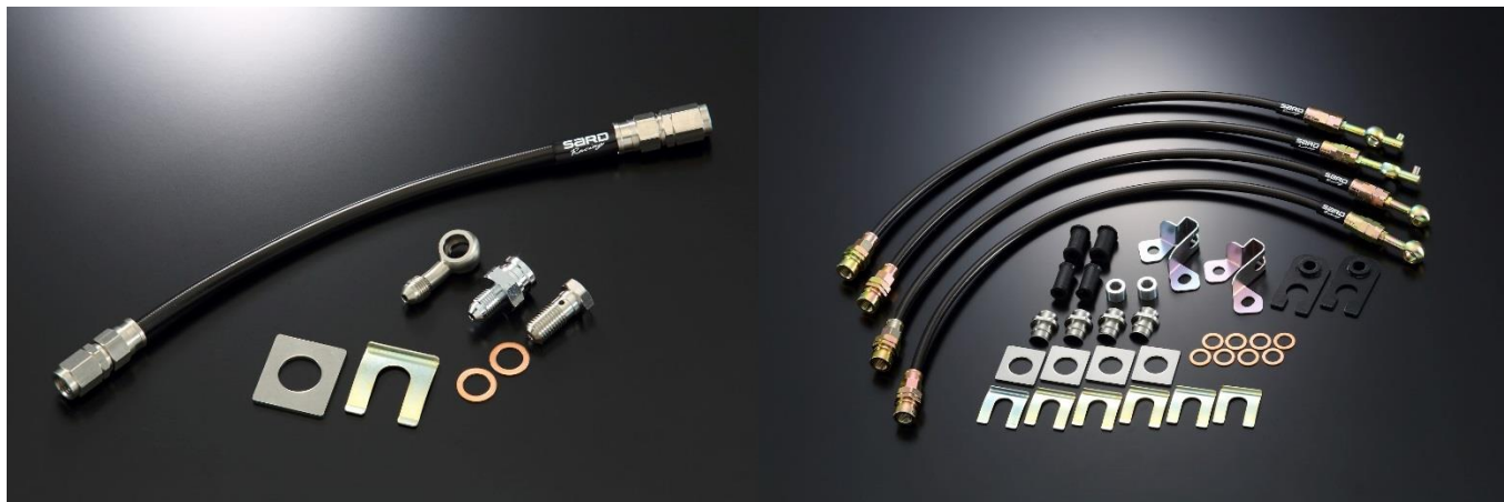
86 CLUTCH HOSE