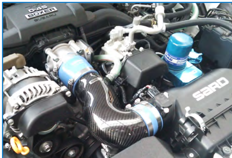
<CARBON INTAKE PIPE TYPE-II 装着写真>